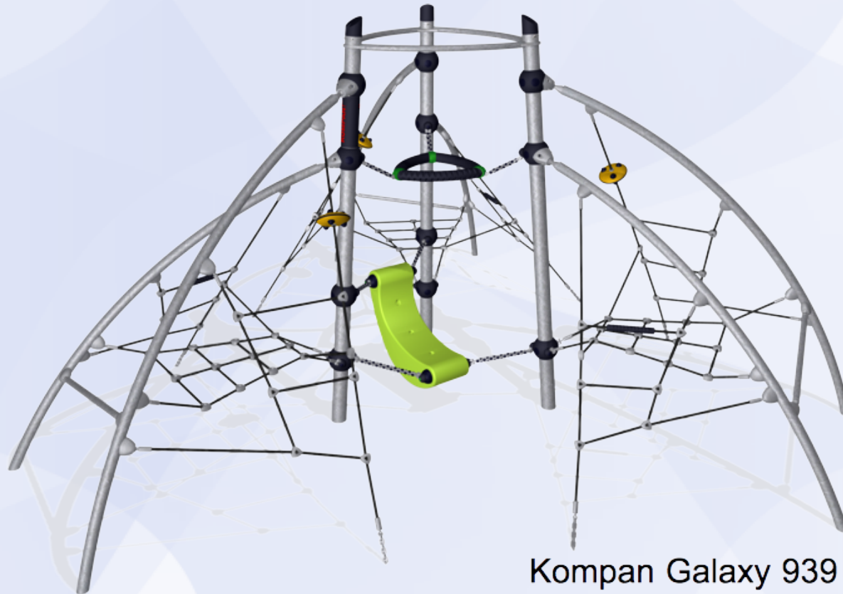
Kompan Galaxy 939