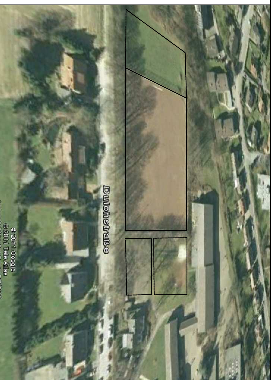
Luftbild ohne Maßstab